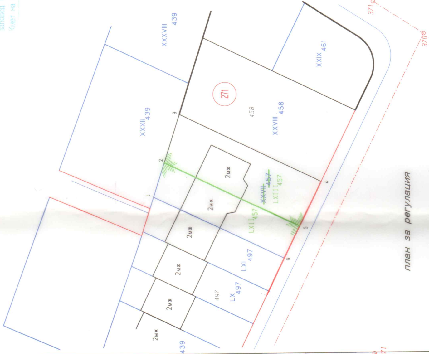
план за регулация

площ на УПИ LXII – 240м 2 площ на УПИ LXIII – 342м 2